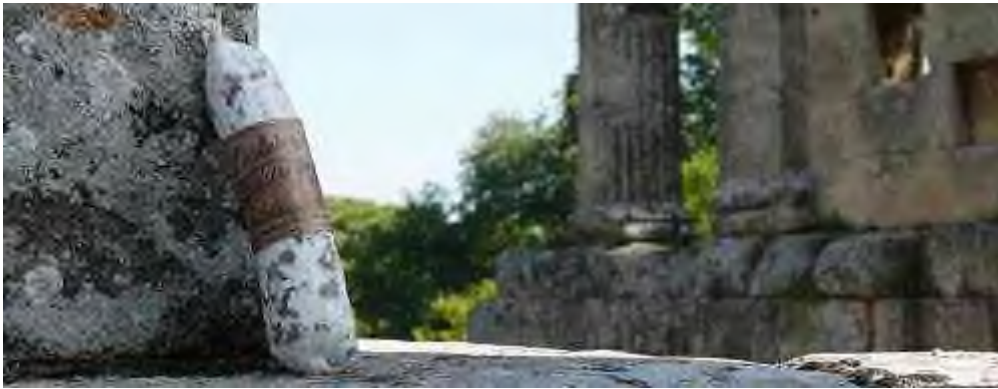
Planche apéritive avec véritable saucisson d'Arles L'arlaten de Maistre Georges

Saucisson de 260g pièce environ, servi avec tapenade et beurre