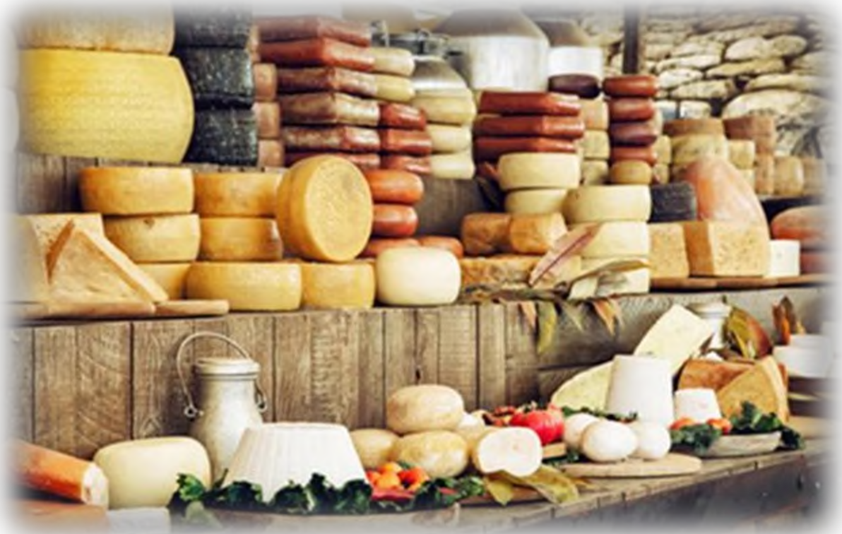
Planche apéritive de fromages