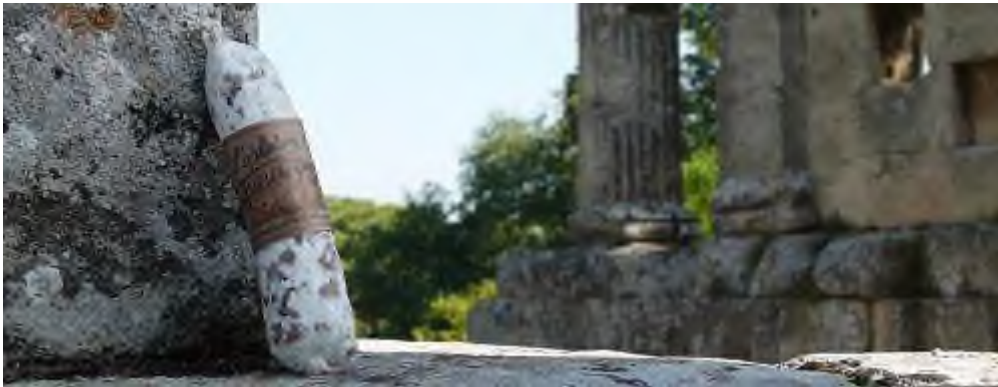
Planche apéritive avec véritable saucisson d'Arles L'arlaten de Maistre Georges

Saucisson de 260g pièce environ, servi avec tapenade et beurre